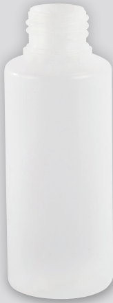
100-ARL ナチュラル・ソフトタイプ