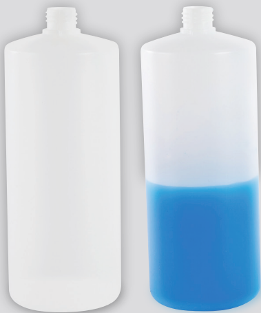
1000-ARN ナチュラル・メモリなし