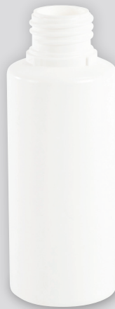
100-ARWL 白・ソフトタイプ