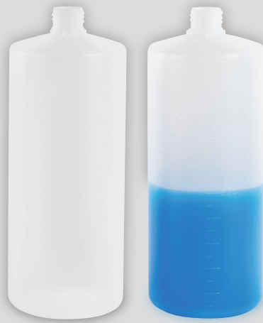
1000-ARM ナチュラル・メモリあり